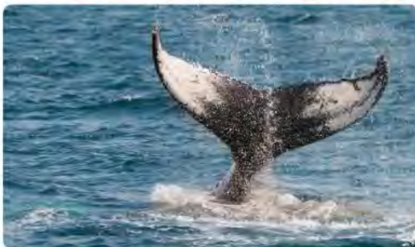
Blue Whale - Balaenoptera musculus

The majestic blue whale, the goliath of the sea, certainly stands alone within the animal kingdom for its adaptations beyond its massive size. At 30 metres (98 ft) in length and 190 tonnes (210 short tons) or more in weight, it is the largest existing animal and the heaviest that has ever existed. Despite their incomparable mass, aggressive hunting in the 1900s by whalers seeking whale oil drove them to the brink of extinction. But there are other reasons for why they are now so endangered.