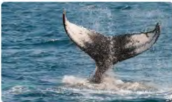
Blue Whale - Balaenoptera musculus

T he majestic blue whale, the goliath of the sea, certainly stands alone within the animal kingdom for its adaptations beyond its massive size. At 30 metres (98 ft) in length and 190 tonnes (210 short tons) or more in weight, it is the largest existing animal and the heaviest that has ever existed. Despite their incomparable mass, aggressive hunting in the 1900s by whalers seeking whale oil drove them to the brink of extinction. But there are other reasons for why they are now so endangered.